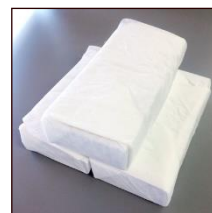
ドライアイス (1日分 10kg)