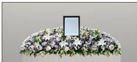
生花祭壇 + 式場設営