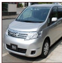
寝台車通常搬送 (市内距離制限なし)