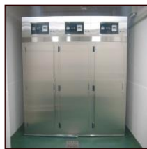
安置施設の利用 (日数制限なし)